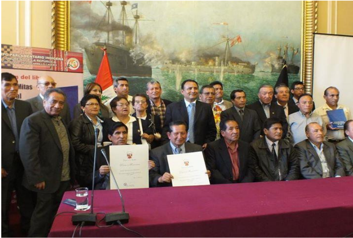
LOS AUTORES DEL LIBRO Y EL PÚBLICO EN EL CONGRESO