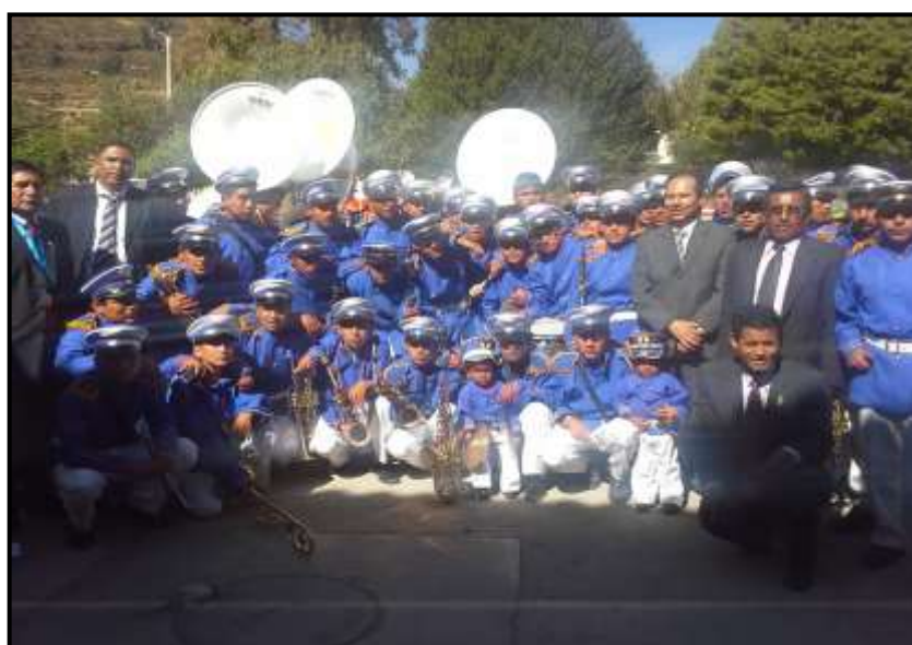
Niños de la Academia de Policía que funciona en Cotarusi