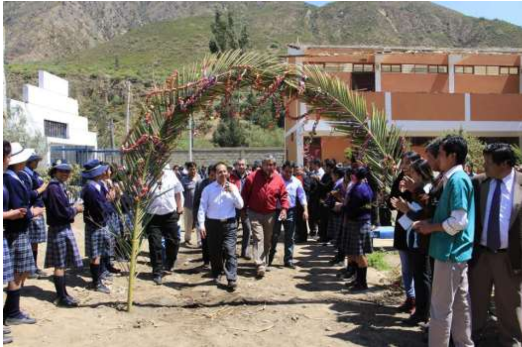
DESPLAZAMIENTO DEL GOBERNADOR REGIONAL EN EL INSTITUTO TECNOLÓGICO DE CHALHUANCA DONDE FUNCIONARÁ PROVISIONALMENTE EL COAR