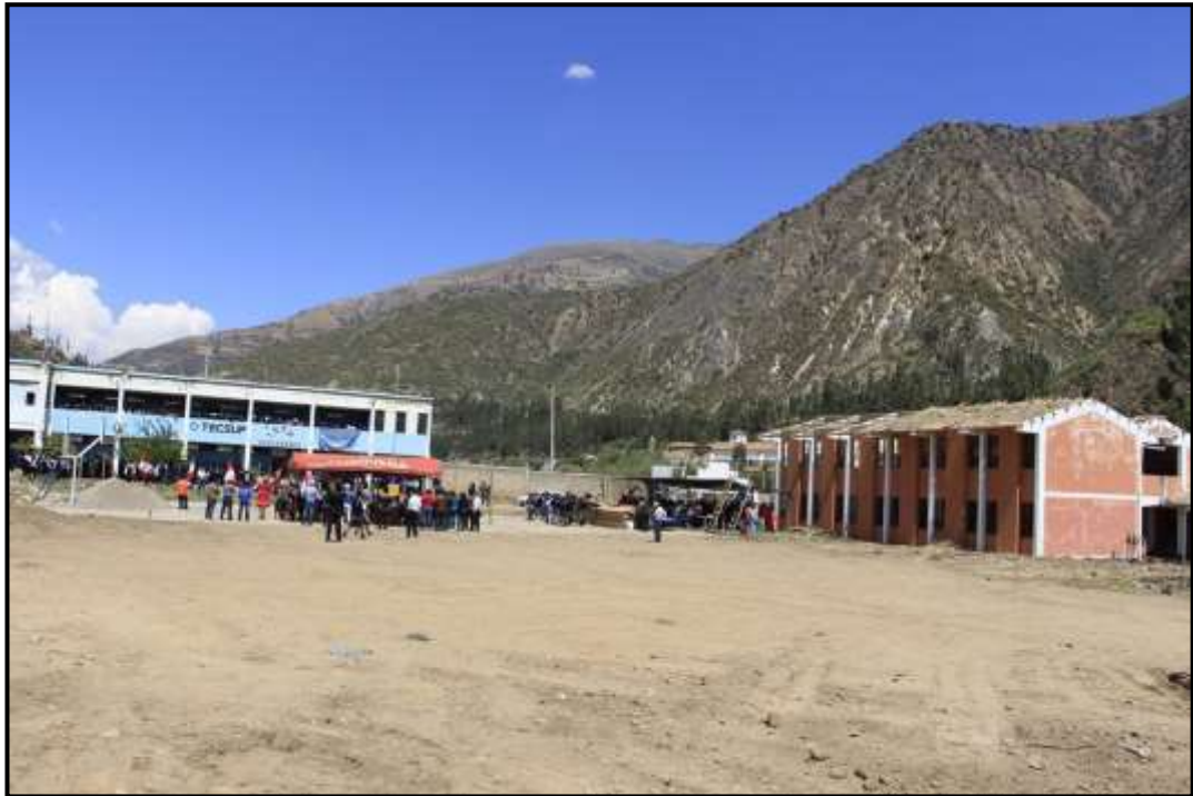
TRABAJOS DE ACONDICINAMIENTO DEL LOCAL DEL INSTITUTO TECNOLÓGICO PARA EL COAR DE AYMARAES