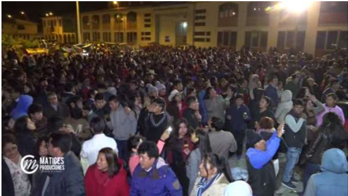
Baile general al compás del grupo musical Hermanos Aybar durante la noche del 31 de julio, en la plaza de armas de Chalhuanca