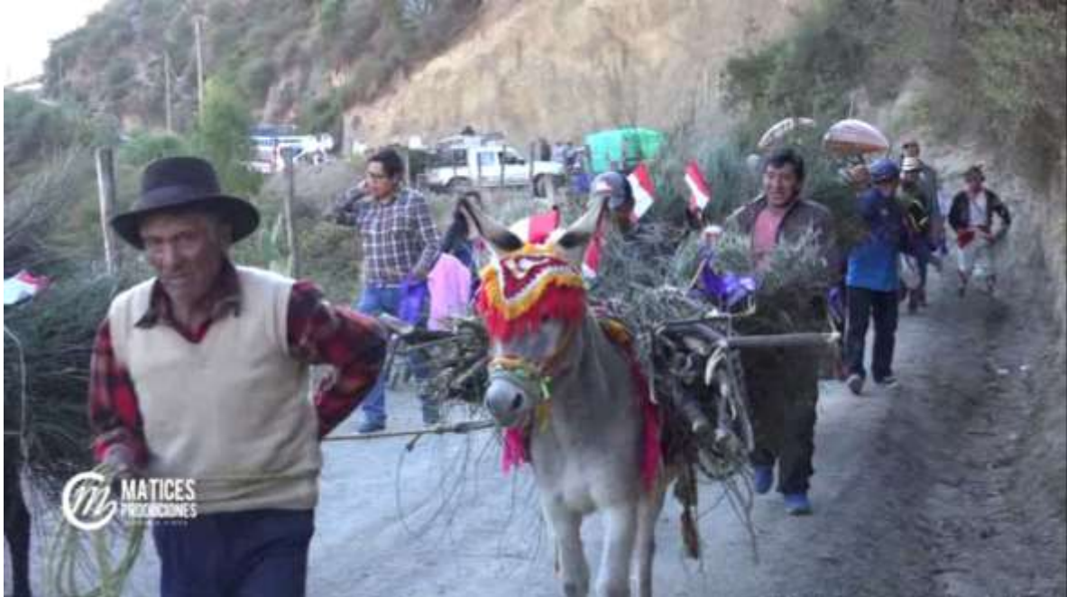
Traslado de leña en burros al local de Llantakuscca

Se llevó a cabo el día 18 de mayo del 2018