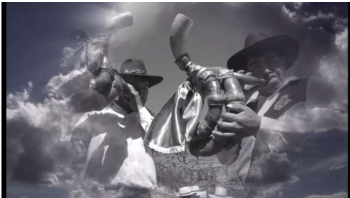
Instrumentos musicales de Wacahuacras ejecutados por los wacrafucus al inicio de la fiesta.