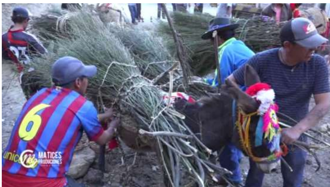
Traslado de retamas secas a la explanada del “Señor de Ánimas de Chalhuanca”