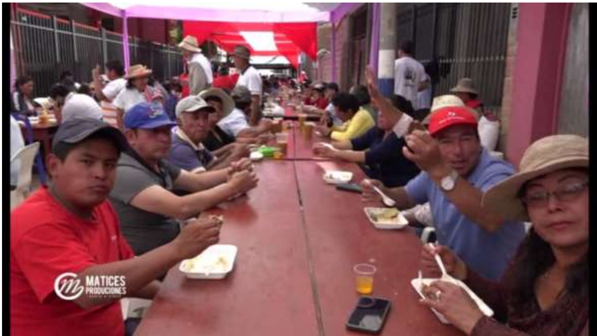
Almuerzo ofrecido por los carguyo'c