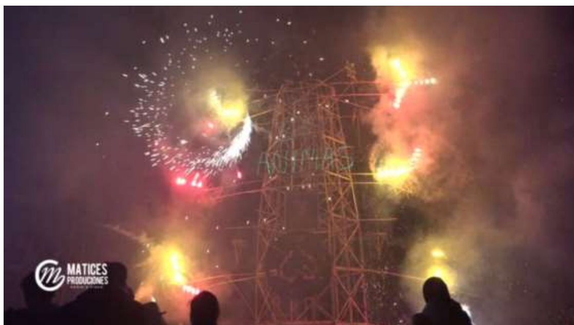
Quema de castillos en la víspera del señor de Ánimas de Chalhuanca.