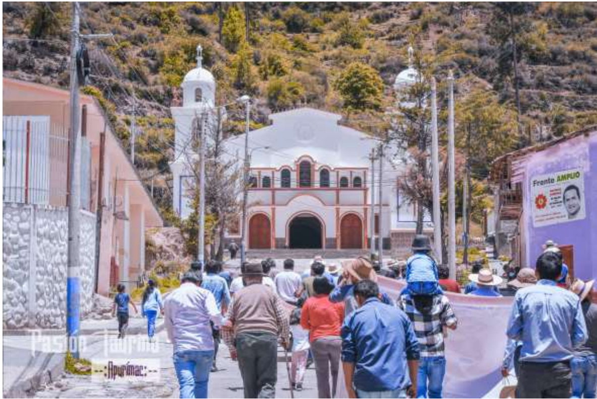
SANTUARIO DEL SEÑOR DE ÁNIMAS (Vista fotogr fica de lejos)