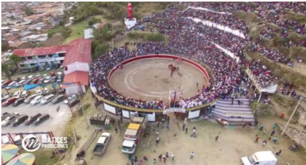
El coloso rueda de toros de Chahuanca y la tribuna natural.