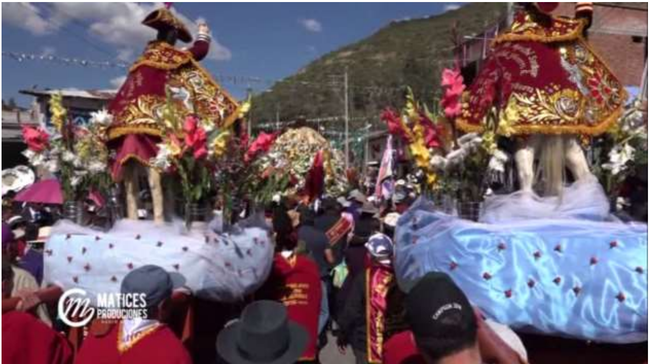
Encuentro del “Señor de Ánimas” con los santos “ Patrón Santiago y San Felipe” de Pairaca; así como con los santos “San Pedro y San Pablo” de Chuquina en la plaza Bolívar.

Durante el transcurso del recorrido de la imagen del “Señor de Ánimas”, por las principales calles de la ciudad de Chalhuanca. Luego consolidando los encuentros de años anteriores se produjo un hecho de trascendental importancia que consolida la fe y devoción de los devotos del milagroso del “Señor de Ánimas”, es decir, en medio de la algarabía de la multitud de los acompañantes se gestó el encuentro del “Señor de Ánimas” con el “Santo Patrón Santiago” y “San Felipe”, procedente de la comunidad de Pairaca, bajo la guía y acompañamiento de sus autoridades y vecinos de dicho centro poblado, encuentro suscitado entre la carretera Panamericana y el Jr. Leoncio Prado de la ciudad de Chalhuanca; asimismo, en forma simultánea, apareció ante la mirada de los asistentes la procesión de los santos “San Pedro y San Pablo” del pueblo de Chuquina, escoltado por sus autoridades y vecinos de la zona, produciéndose un saludo suigéneris que perdurará para siempre en la historia de la fiesta del “Señor de Ánimas”. Este acto singular de encuentro se realizó en la plaza Bolívar de la localidad de Chalhuanca, en medio de sendos aplausos, discursos, oraciones, plegarias, cánticos y otras manifestaciones culturales, sociales y religiosas.