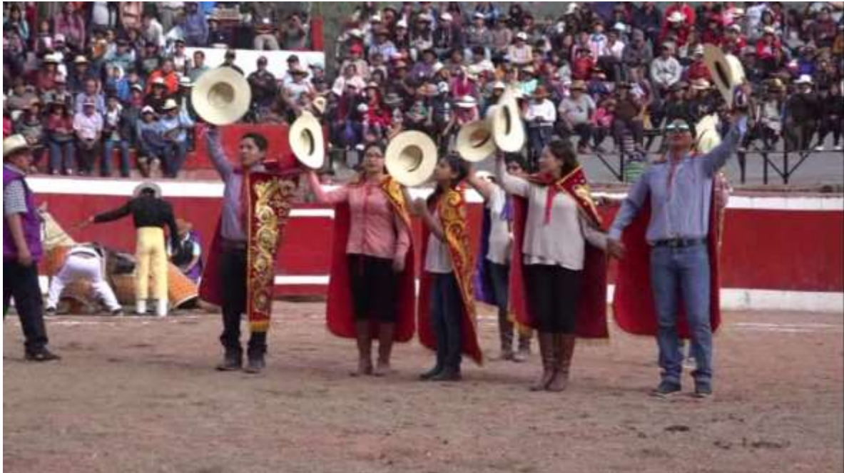
Saludo al público desde el coloso ruedo de toros de Chalhuanca por los capitanes del primer día