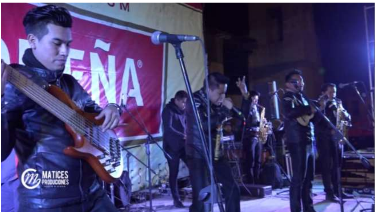
Conjunto musical raíces de Jauja (Junín).