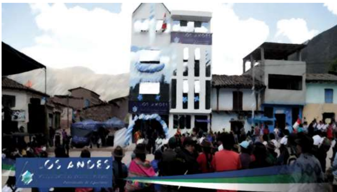
Inauguración de su moderno local de la Cooperativa los Andes de Cotarusi, agencia de Chalhuanca

https://www.youtube.com/watch?v=2NaltwoGJVY&t=20s