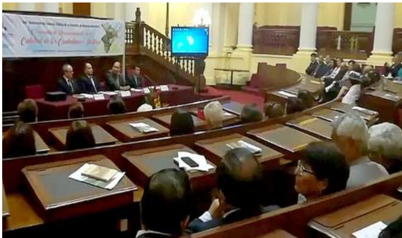
Difunden versión no autorizada de Himno de Abancay en el Congreso de la República