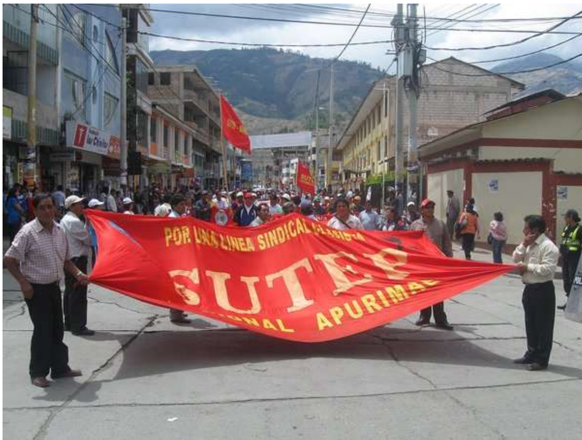
Menos del 10% de profesores acatan huelga en Apurímac