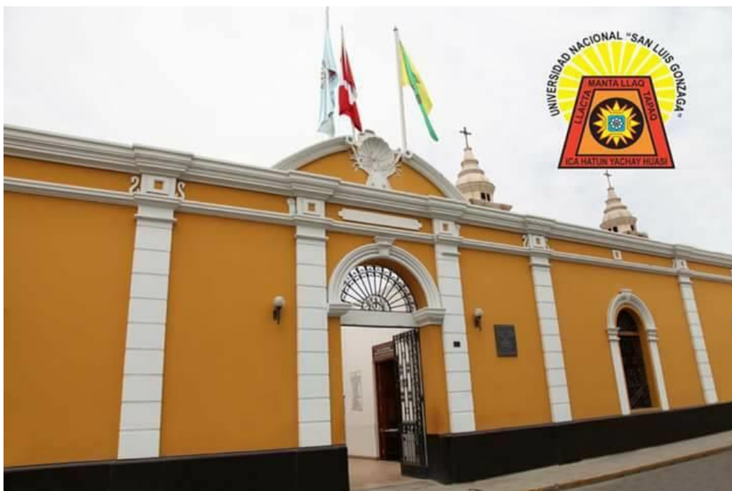
Universidad Nacional San Luis Gonzaga de Ica

LA UNICA FIRMÓ CONVENIO DE COLABORACIÓN INTERINSTITUCIONAL CON LA MUNICIPALIDAD PROVINCIAL DE AYMARAES – APURIMAC