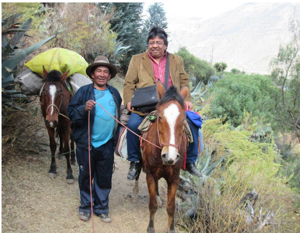
Viaje camino a Tiaparo