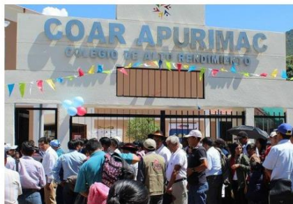
Terreno ubicado en la Comunidad campesina de Chuquina, en el distrito de Chalhuanca, Provincia de Aymaraes, Departamento de Apurímac