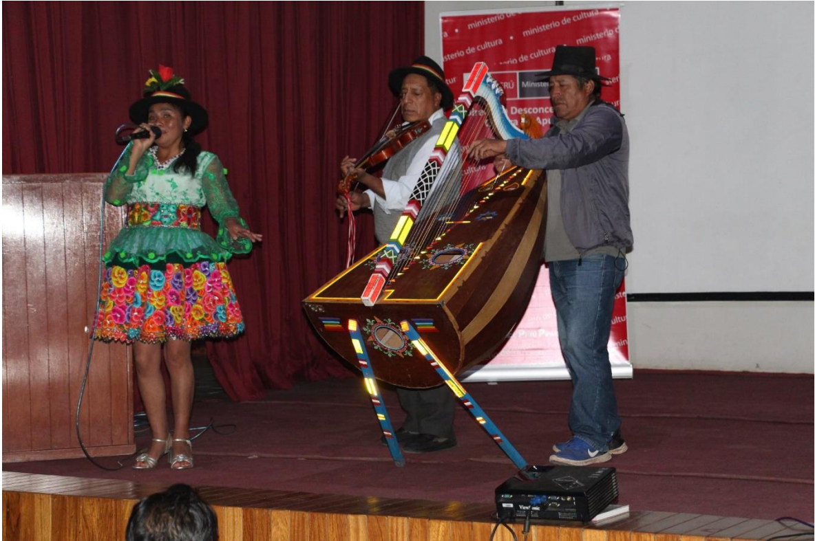
Publicado en enero 31, 2020 por hawansuyo