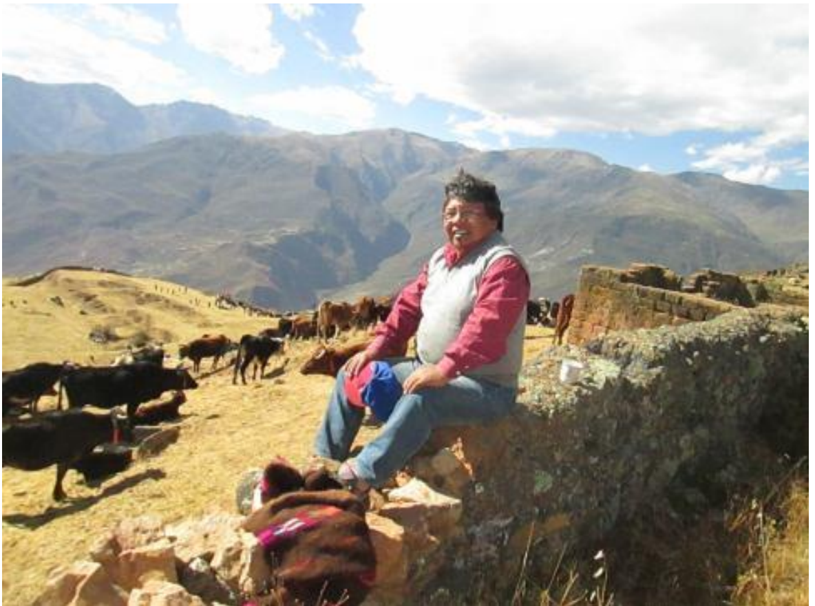
Apurunku en Tiaparo