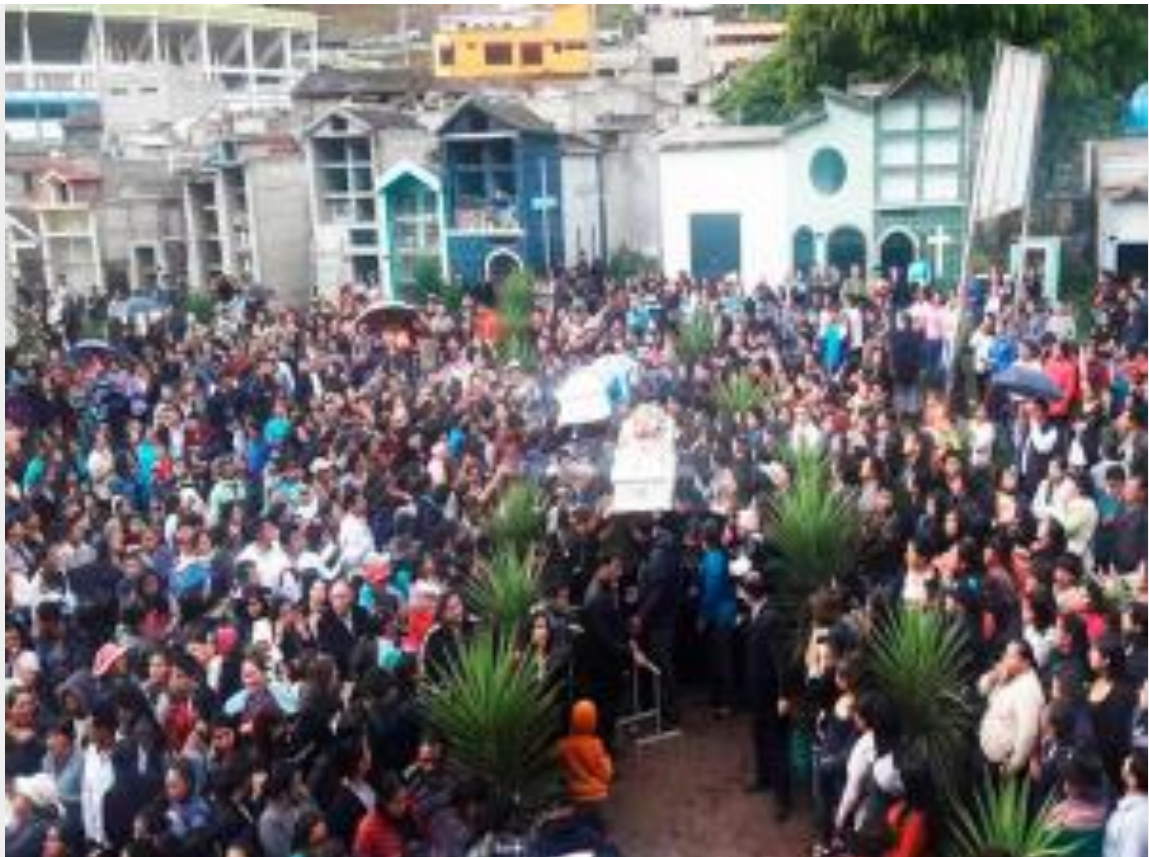
Multitudinario fue el último adiós a fallecidos en tragedia en el local de Alhambra