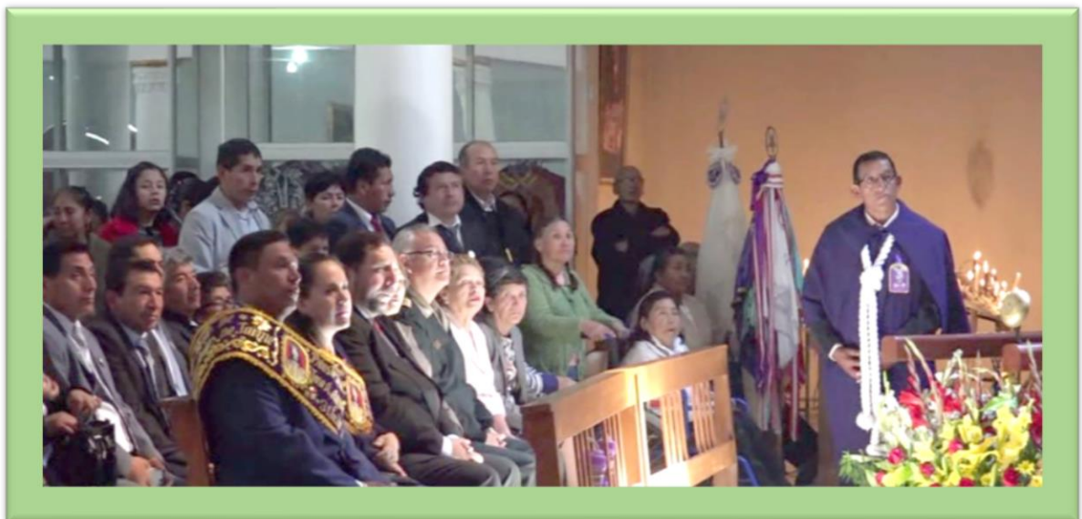
Priostes capitanes de plaza, autoridades y público en general asistentes a la sagrada misa del día central en el santuario del Señor de Ánimas