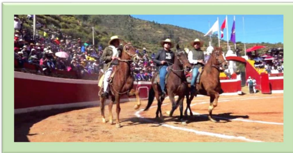
Demostración de expertos jinetes ayacuchanos saludando al público en la explanada del ruedo de Chalhuanca