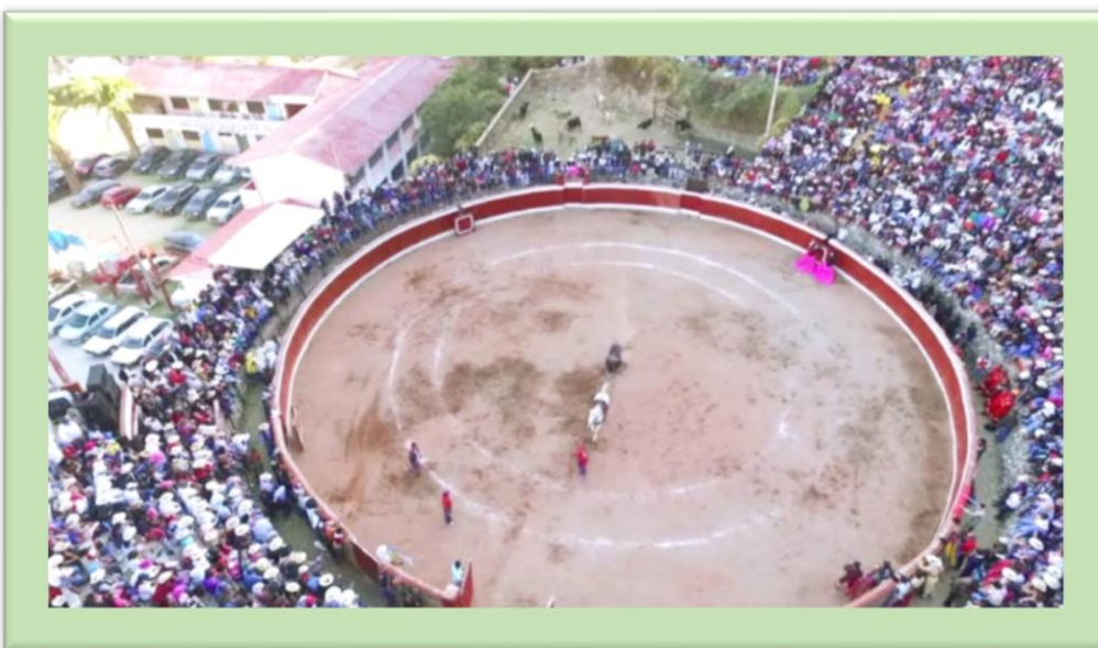
Toro de muerte en el ruedo, arrastrado por el caballo fuera del ruedo taurino