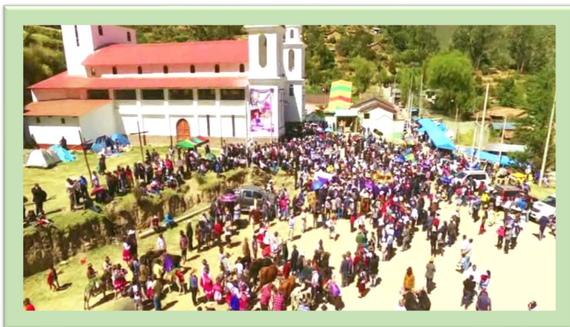
Recorrido de la imagen del Señor de Ánimas, echando bendiciones a los cargos menores y participantes de las costumbres tradicionales en la explanada del santuario