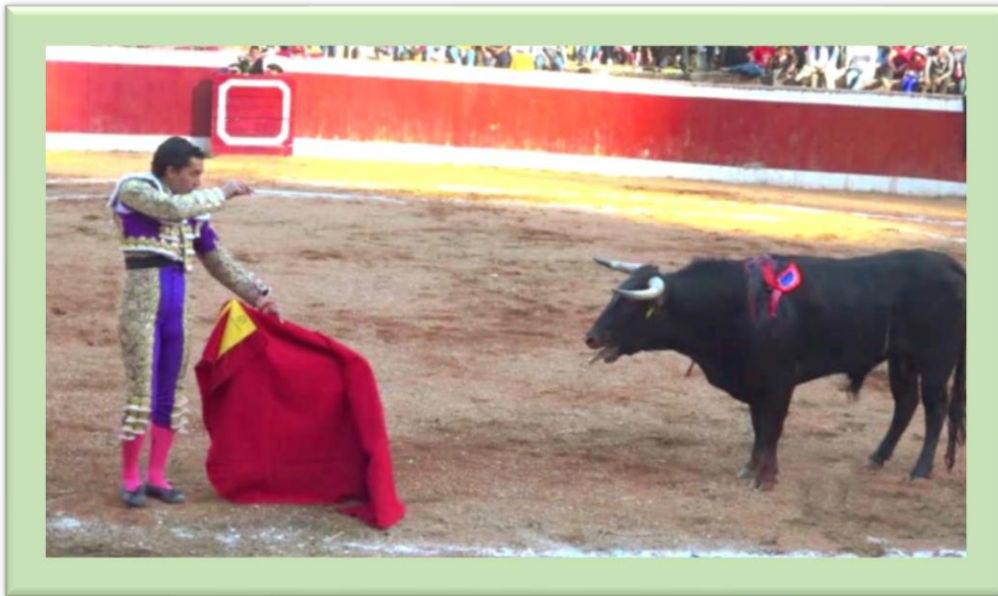
Juan Carlos Cubas, torero matador (peruano) a punto de estocar al toro de muerte