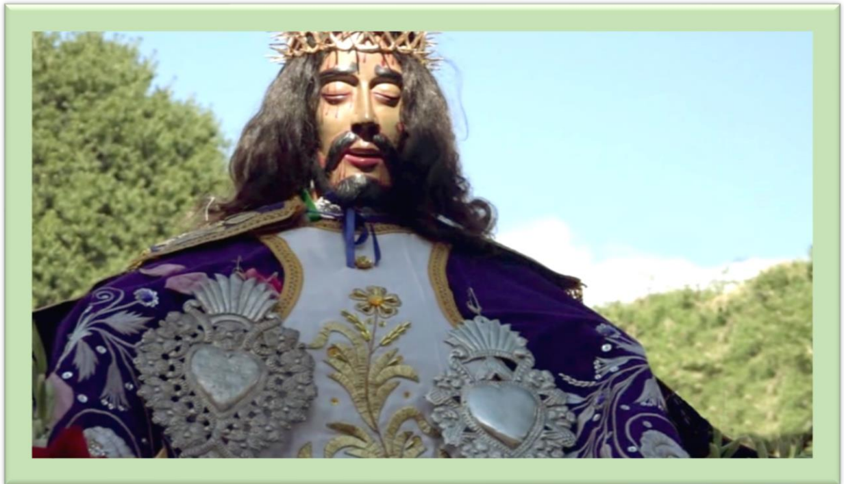
Imagen del milagroso Señor de Ánimas en su Santuario – Año 2019.