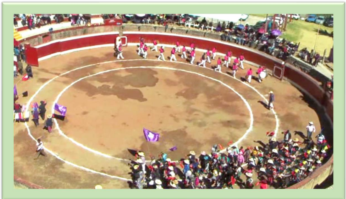
Ingreso al ruedo de la Directiva de la Institución Matriz Señor de Ánimas acompañado por el público y la banda de músicos

Conforme al cronograma elaborado la actividad taurina del primer día del mes de agosto inició con la celebración de la misa a cargo de los capitanes de plaza, en este caso representado por la Junta Directiva de la Institución Matriz Señor de Ánimas de