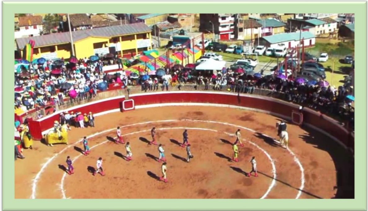
Ingreso de los toreros mataderos al ruedo, acompañados por los subalternos, entre el picador, bandilleros y jaladores de caballo de toros de muerte