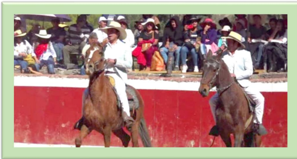
Jinetes Ayacuchanos a caballos en el ruedo cantando la canción “Río Grande de Chalhuanca”