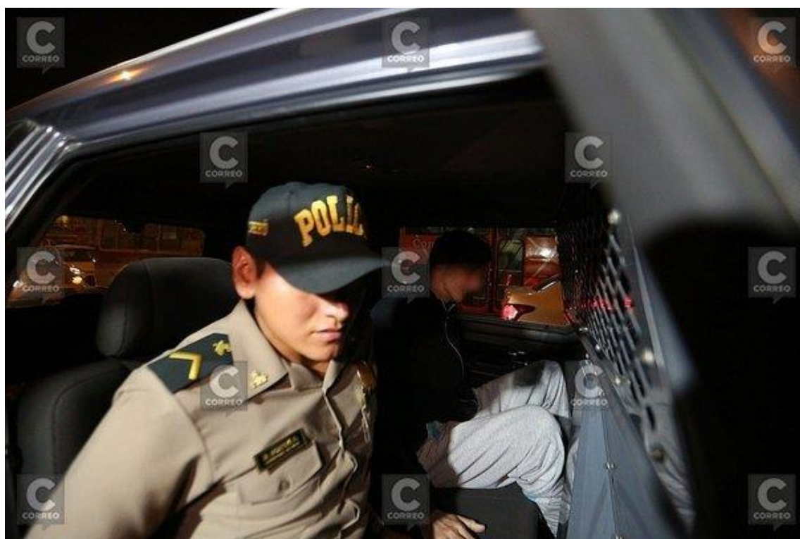
En Apurímac piden expulsión de extranjeros con antecedentes delictivos

11 de Octubre del 2019 - 09:43 » Textos: P. Pilco