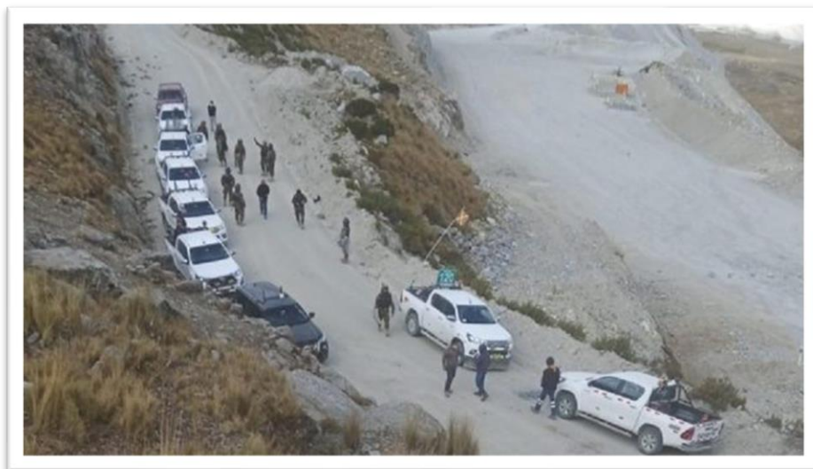
Una persona se encuentra herida por el impacto de perdigones.

Actualizado el 31 de mayo del 2022 10:18 PM