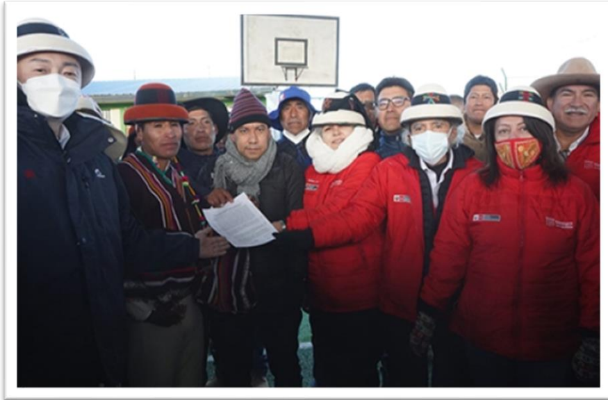
Comunidades de Cotabambas acuerdan tregua de 30 días para que la minera reinicie Operaciones y se restablezcan actividades comerciales en provincia de Cotabambas.

Una comitiva oficial del Ejecutivo, liderada por la ministra de Energía y Minas, Alessandra G. Herrera Jara, se reunió con los representantes de seis comunidades de la provincia de Cotabambas en el centro poblado de Pumamarca, región Apurímac, para alcanzar una solución a las controversias que mantienen con la minera MMG Las Bambas.