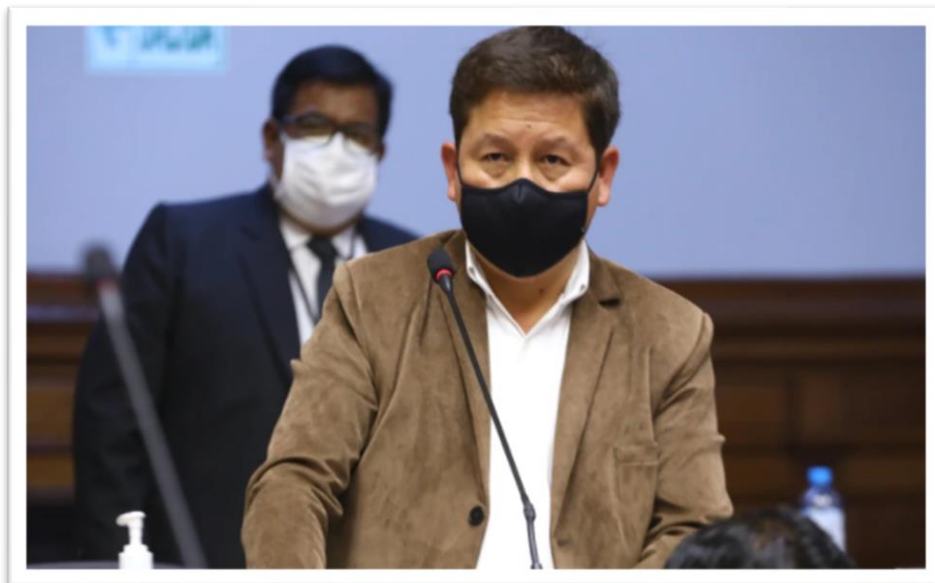
Guido Bellido es uno de los congresistas que representa a la región de Cusco.