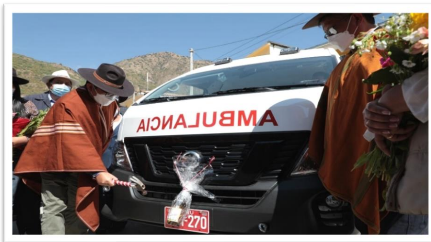
Forman parte del lote de unidades móviles donadas por el Gobierno de Japón