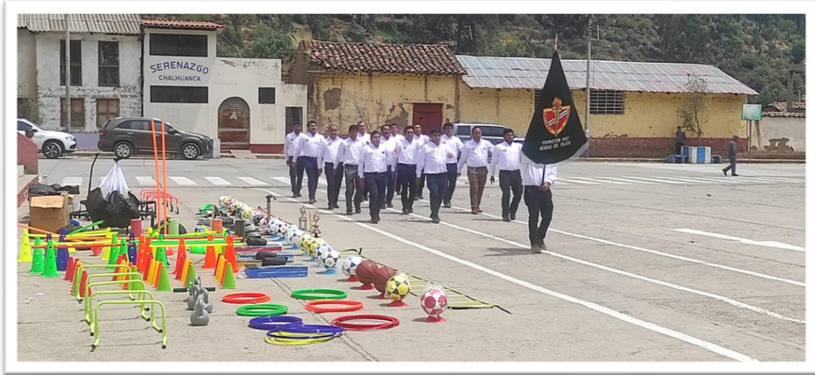
DESFILE DE LA PROMOCIÓN 1997. Donó al Colegio objetos deportivos