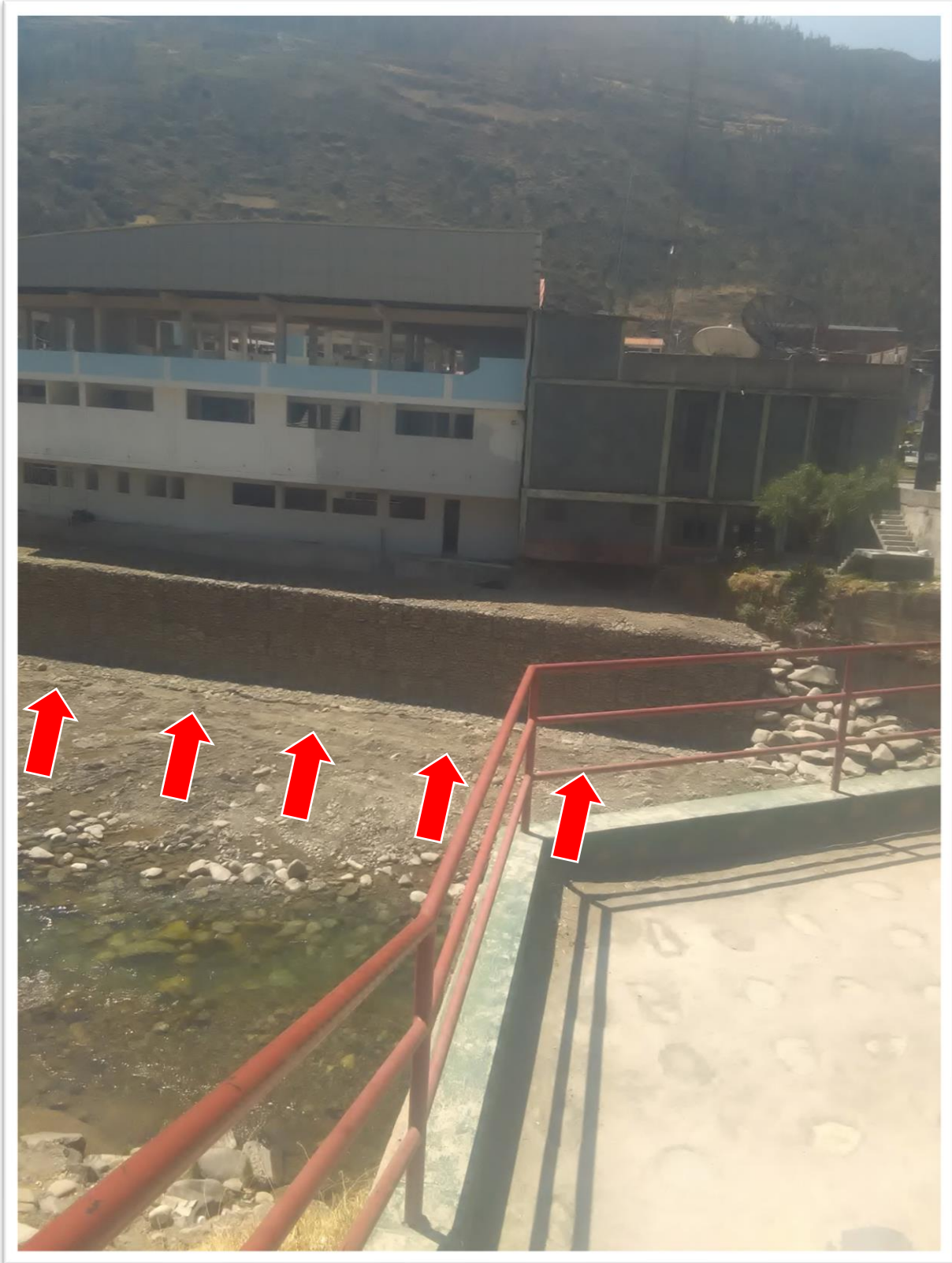
Muro de contención de defensa ribereña junto al nuevo mercado de abastos