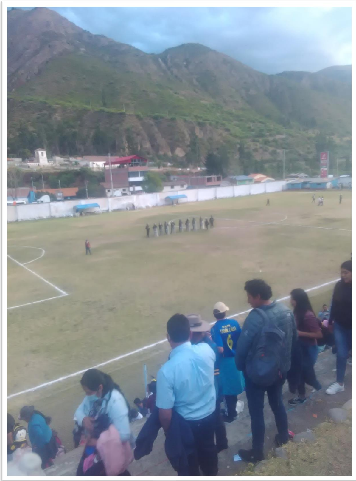
Resguardo policial en el campo deportivo del Stadium de Urubamba en Chalhuanca