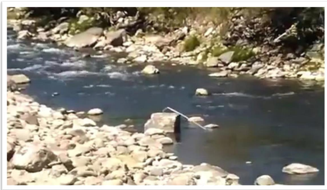
Denuncian contaminación del río en Chalhuanca

Hemos tenido conocimiento mediante un video publicado en redes sociales, que los trabajadores de Municipalidad de Aymaraes estarían echando residuos tóxicos de pozo séptico en el río contaminando seriamente el río Chalhuanca, exactamente en el lugar denominado tierra negra Pairaca. Pobladores denunciantes pidieron intervención inmediata de la fiscalía del medio ambiente y la OEFA, asimismo pidieron que se pronuncie el área del medio ambiente de la municipalidad. Según dijeron, dicha actitud irresponsable de trabajadores sería de forma sistemática. “Cómo es posible que los trabajadores de la municipalidad estén contaminando el río