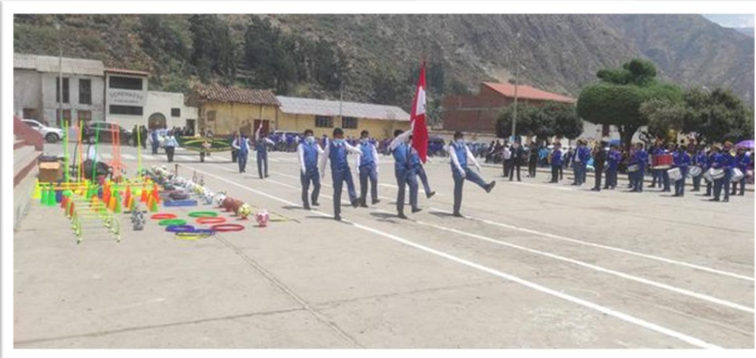
Paso de la escolta de alumnos del Glorioso Colegio "Libertadores de América"