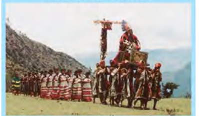
SANTUARIO NACIONAL DEL AMPAY (APU-TINCAI) EN ABANCAY