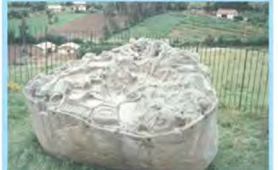
PIEDRA DE SAYWITE

Límites : Con Cuzco, Arequipa y Ayacucho Extensión de : 20,654 kms2. Población de : 371 mil habitantes. Su capital es : La ciudad de Abancay