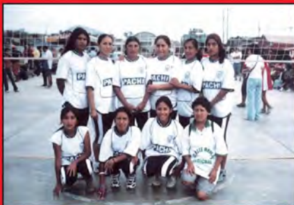
Equipo de Voley Femenino - Defensor Canchuillca 2006