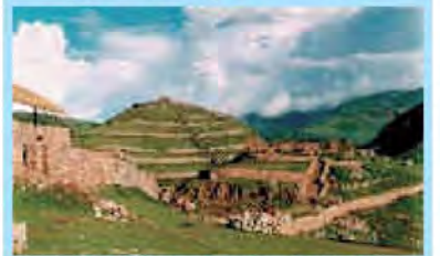
LA FORTALEZA DEL SONTOR EN ANDAHUAYLAS