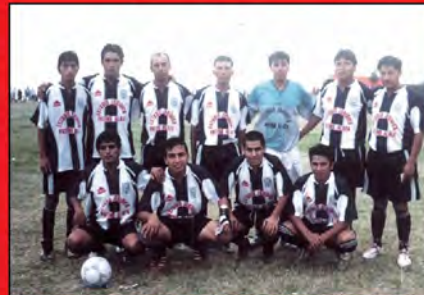
Equipo de Futbol - Club Defensor Canchuillca 2006