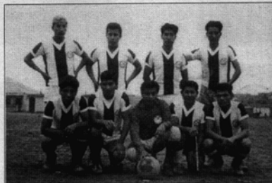
Primer equipo del Club Defensor Canchuilla 1,966