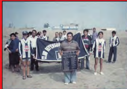
Consejo Directivo y equipo de voley Club Defensor Canchuillca